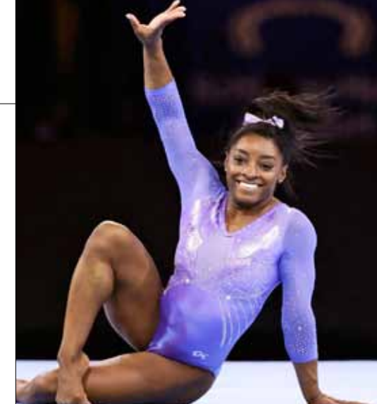
Simone Biles 22, ginnasta americana. È single.

guidando le Azzurre fino ai Mondiali di Francia per regalarci vittorie memorabili, degne di un boom di ascolti televisivi mai visto. Perché ci piace È una tosta, vuole essere chiamata Miss e non Mister, è nata per vincere, ma non da sola: le sue ragazze fanno squadra, senza i protagonismi del calcio maschile. Combatte contro i pregiudizi insensati che denuncia nel libro da lei curato Giocare con le tette (Compagnia editoriale Aliberti).