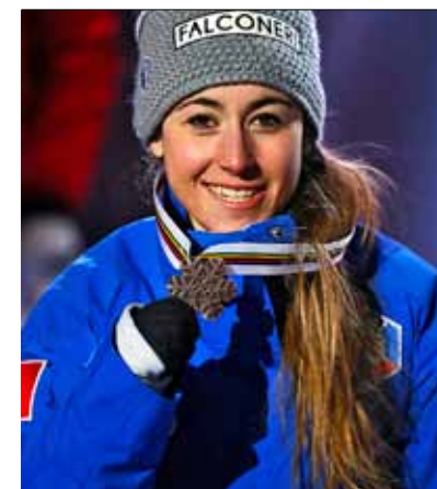
Sofia Goggia 27, sciatrice italiana. È single.

Stoccarda del 2019, dove ha stupito ancora una volta giudici e pubblico con i suoi prodigi. Perché ci piace È nera, povera e donna: arrivando al successo ha vinto una triplice sfida. E poi ha coraggio da vendere, ha gridato il suo #MeToo , associandosi alle denunce delle giovani atlete contro Larry Nassar, il medico della Federazione oggi in carcere per molestie. «Sapevate, ma non ci avete tutelato!», ha detto.