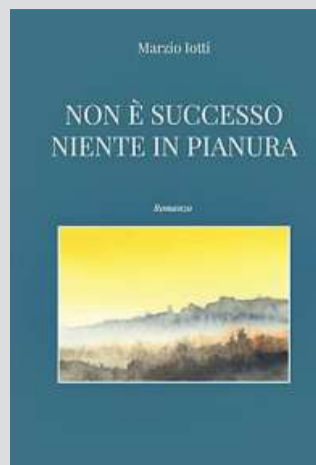
La copertina del libro

Iotti si dimostra un buon narratore e la lettura è scorrevole e piacevole. La trama del racconto è arricchita da riflessioni esistenziali. «Adesso lui era in viaggio perché gli anda-