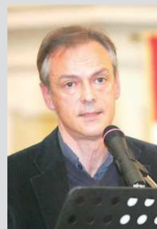
Marzio Iotti, ex sindaco di Correggio

va di viaggiare, si era fermato perché aveva voglia di fermarsi e poteva, concretamente, fare ciò che voleva, quando voleva (...). Non era tanto la ricchezza che gli consentiva