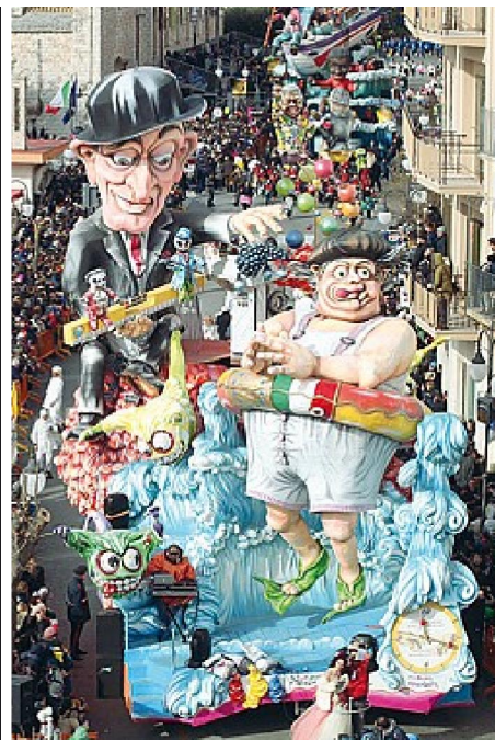
La festa è iniziata nel giorno di Santo Stefano e si concluderà con la spettacolare sfilata del Martedì grasso, ai rintocchi della Campana dei Maccheroni

Intanto, i gruppi organizzati dei carristi sono al lavoro negli hangar per dar vita ai giganti in cartapesta che nelle sfilate del Carnevale attraversano le vie principali della cittadina che ospita il Carnevale più lungo d'Europa. Si comincia nel giorno di Santo Stefano per concludere la grande festa con la spettacolare sfilata del Martedì grasso, ai rintocchi della Campana dei Maccheroni, rigorosamente in cartapesta, che segna la fine delle bagdori