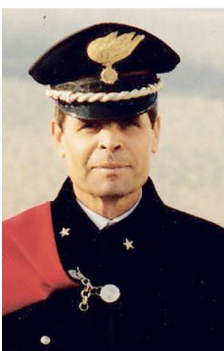
Generale dei Carabinieri VITTORIO DE LUCA

La tua non è assenza, ma un modo diverso di stare ancora con noi. In ogni momento.