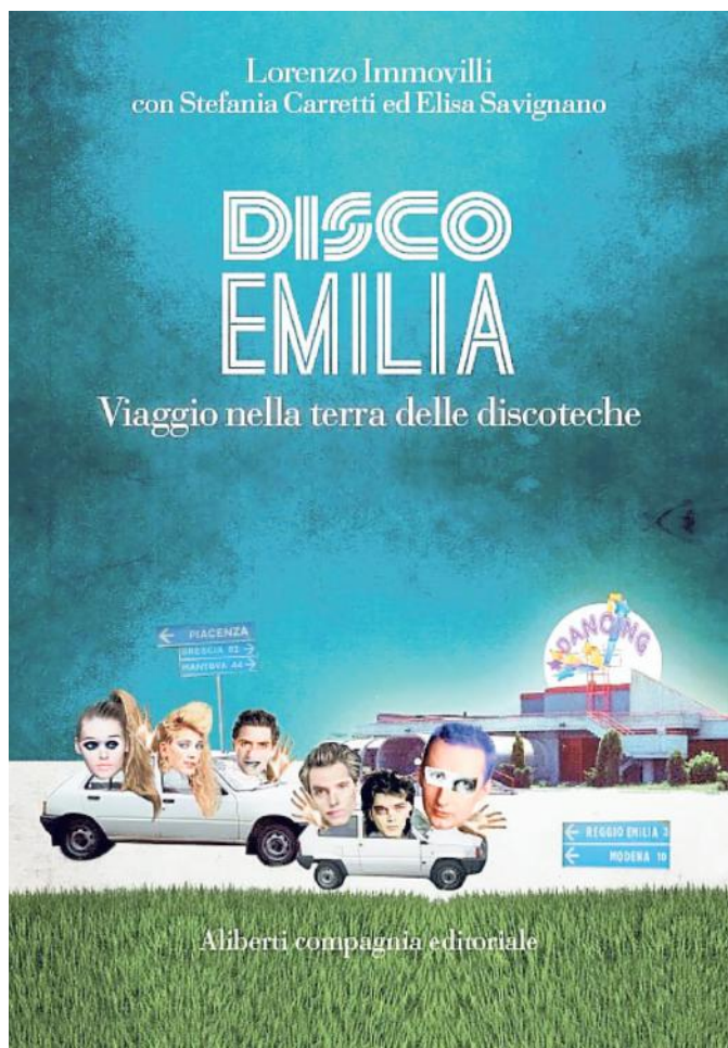
La copertina del libro dedicato a Disco Emilia

Disco Emilia è il ritratto di una naturale attitudine emiliana allo "stare insieme" e al giocare attraverso il ritmo della musica: dalle aie dei cortili contadini, alle feste dell'Unità, dall'esplosione dei fenomeni Disco alla nascita dei club di tendenza, una vera epopea del costume in cui musica, immagine, moda, tecnologia e spettacolo si sono mescolati freneticamente in una crescita esponenziale, fino a giungere al de-